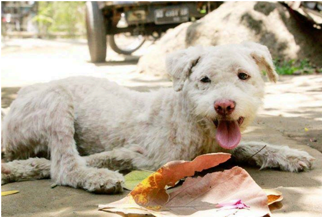
Albus - anjing poodle yang menggelandang dengan sakit kulit parah ketika ditemukan