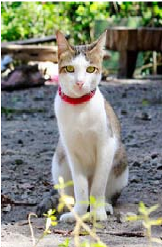
Chimney - terperangkap dalam pipa AC sebuah Mall