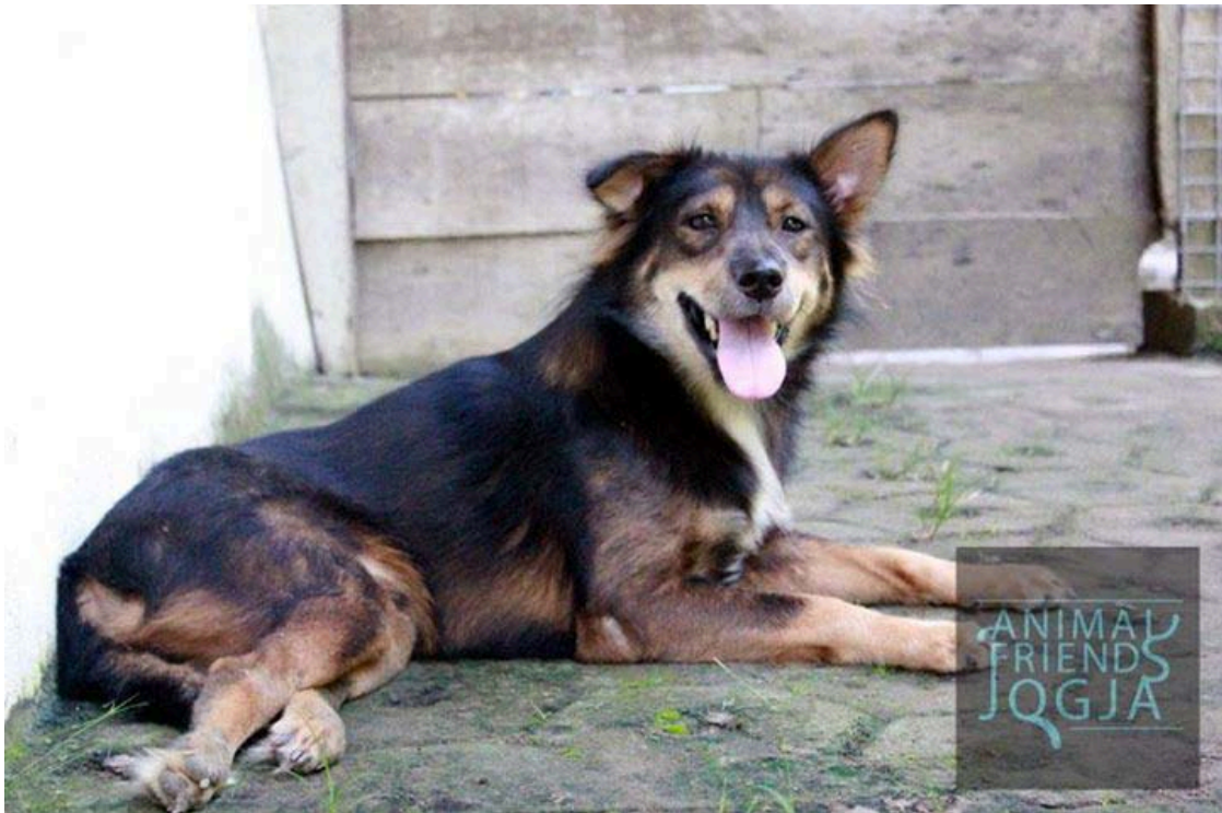
Buster - anjing yang lumpuh karena kasus tabrak lari